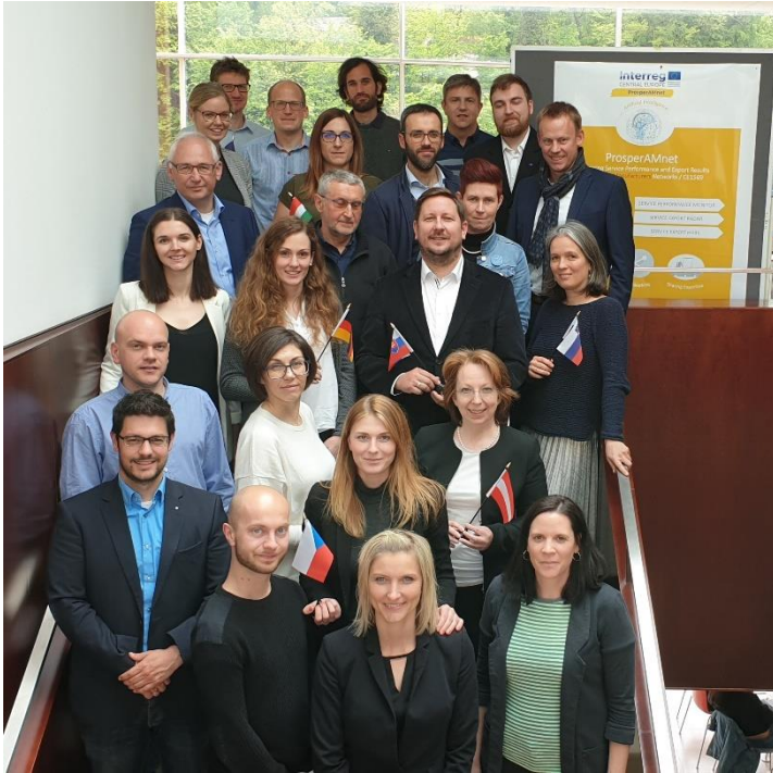
Gruppenfoto des Forschungsteams im Rahmen des Kick-off Meetings am 6.-7. Mai 2019