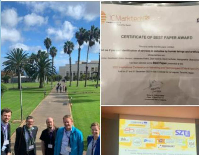
ProsperAMnet booth - Biz-up & FHOÖ

👉 At the 'Smart Automation Fair' in Linz, we invited manufacturing companies to test the Service Export Radar and attracted interested participants for the Austrian online Round Table on 9.11.2021.