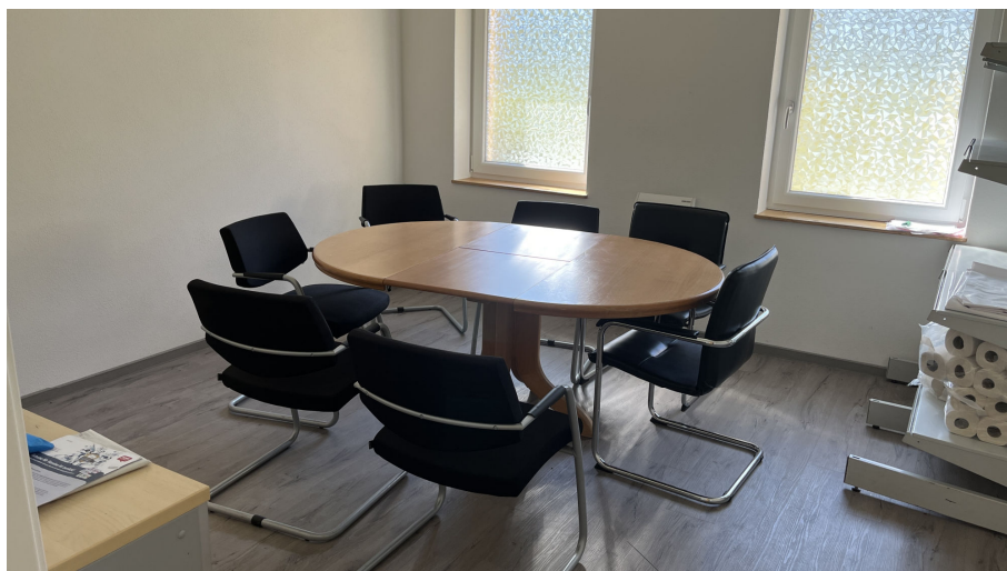
1. Raum links