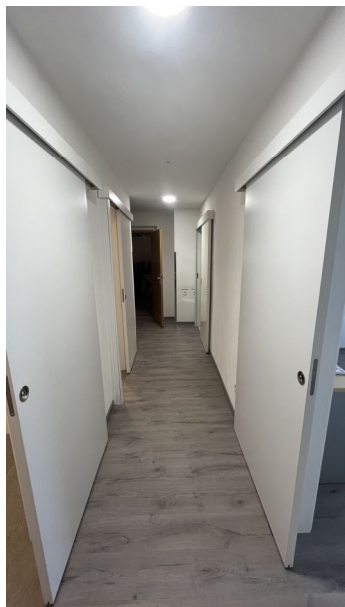
1. Raum rechts